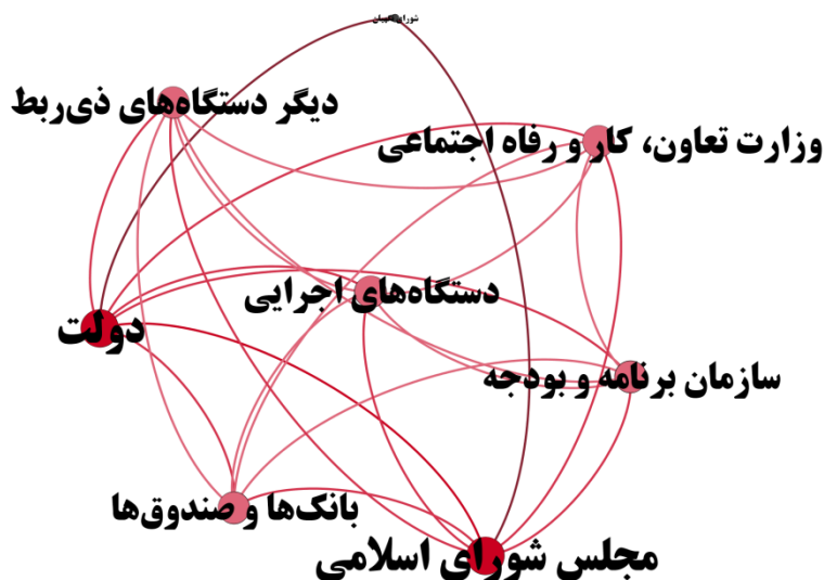
شکل ۲. موقعیت هندسی کنشگران در شبکه قانون حمایت از توسعه و ایجاد اشتغال پایدار در مناطق روستایی و عشایری

نتایج سنجه‌های سطح خرد شبکه در شبکه قانون ساماندهی و حمایت از مشاغل خانگی که در جدول ۴ ارائه شده، نمایانگر نقش و تأثیر کنشگران مختلف در این نظام حکمرانی است. دولت و وزارت کار و امور اجتماعی با مرکزیت درجه ۱۰۰ درصد و مرکزیت مجاورت ۱۰۰ درصد، بیشترین سطح تأثیرگذاری را در این شبکه نشان دادند. این وضعیت بیانگر آن است که دولت و وزارت کار به‌عنوان نهادهای کلیدی در سیاستگذاری و حمایت از مشاغل خانگی، نقش محوری در ایجاد و ساماندهی این نوع مشاغل دارند. مرکزیت بینابینی این دو نهاد (۲۸ درصد) نیز نشان‌دهنده توانایی آنها در تسهیل ارتباطات میان بقیه کنشگران است که می‌تواند به بهبود همکاری‌ها و کاهش چالش‌ها کمک کند.